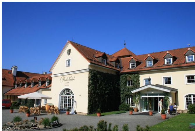
Parkhotel Kašperské Hory