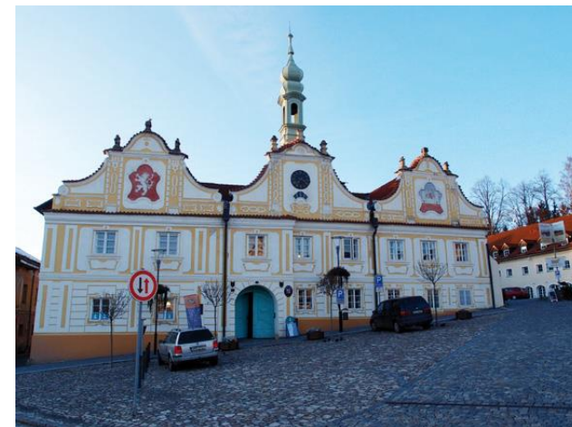
Kašperské Hory - radnice