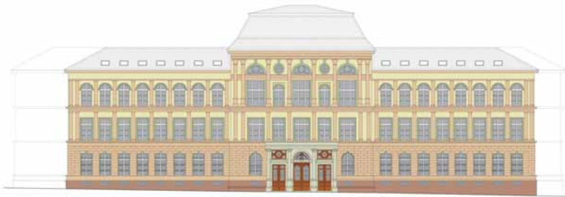
POHLED OD SMETANOVÝCH SADŮ

komunity. Zde se diváci rozhodnou, zda budou „proti směru času“ pokračovat v prohlídce až k osidlování ve třináctém století, nebo zda po točitém požárním schodišti vystoupají o patro výše, kde si pod mottem „Modernizace v multietnické společnosti“ prohlédnou různé aspekty vývoje až na práh jednadvacátého století.