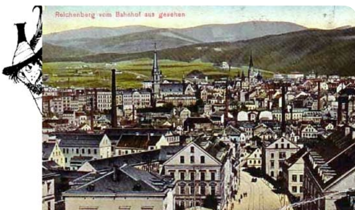
Ilustrace F. J. Trippa, Liberec, 1909, nakladatelství Thienemann

Českou tematikou v díle Otfrieda Preußlera se zabývalo vědecké symposium, které se konalo od 12. do 14. června na Univerzitě Jana Evangelisty Purkyně v Ústí nad Labem. Pořádajícími byly za českou stranu Collegium Bohemicum, Ústí nad Labem a katedra germanistiky Univerzity J. E. Purkyně, na straně rakouské Rakouská společnost pro studia literatury pro děti a mládež ve Vídni. Přestože je Otfried Preußler jedním z předních německých autorů s mezinárodní reputací, dosud mu nebyla věnována dostatečná pozornost ani jako spisovatel fantastické literatury pro děti, ani jako spisovatel německočeskému. Celým jeho dílem totiž kromě legend a pověstí z Česka postupuje také téma útěku a vyhnání, které popisuje sice různými literárními způsoby, ale na základě vlastních traumatických zkušeností. Preußler totiž pochází z Liberce a jeho rodina byla v roce 1945 odsunuta. Ústecká konference měla tuto