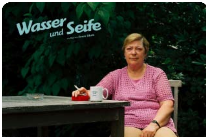
Femina Film 2009. Tématická sekce „Profesionálky“

S finanční podporou Goethe-Institutu Praha.