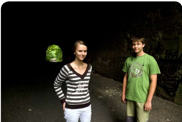
Místa paměti: Postoloprty