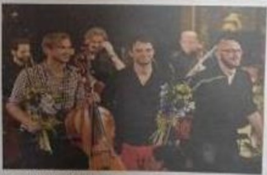
ZE ZAHÁJENÍ DNŮ KULTURY v Ústí nad Labem.